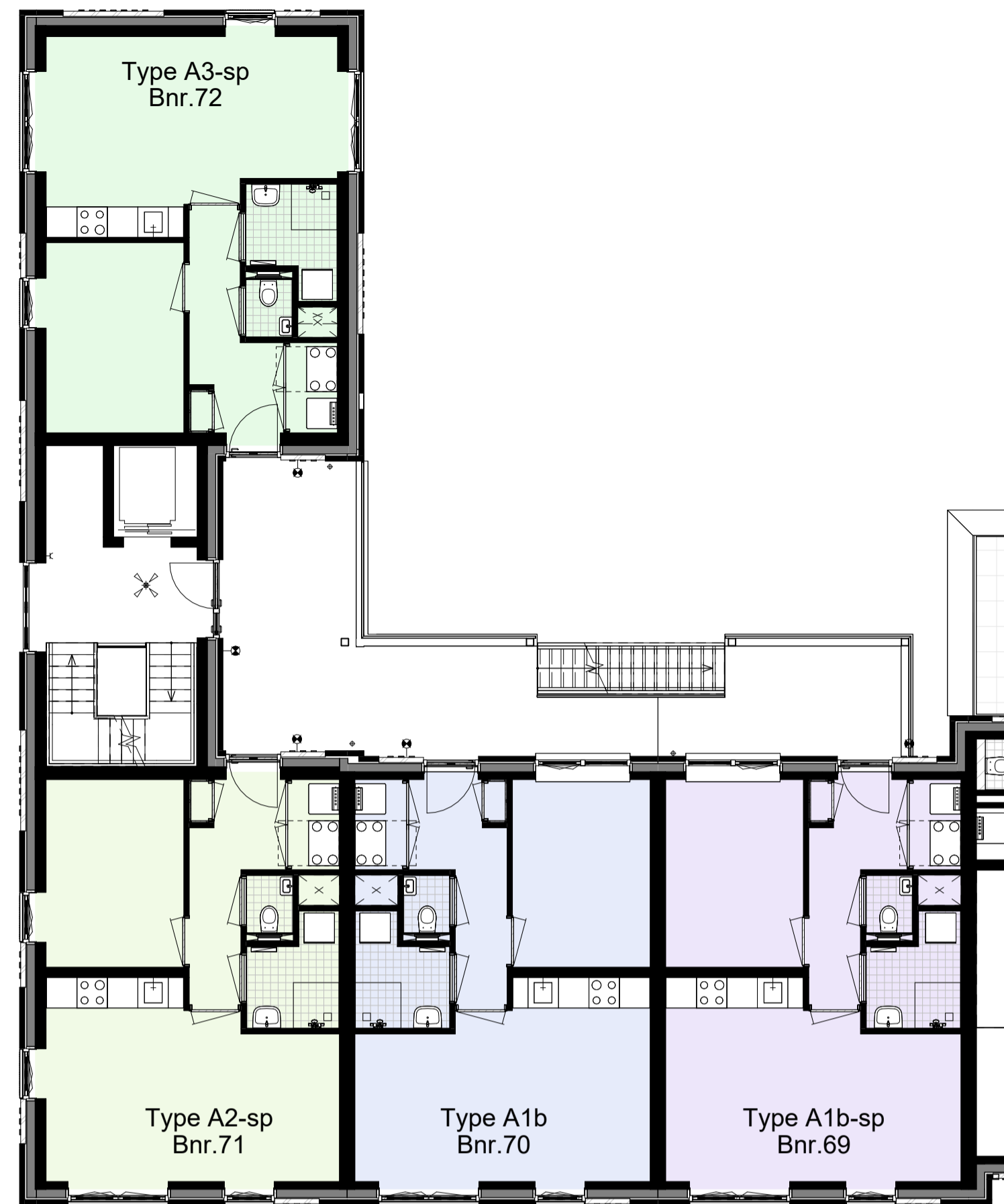
Eerste verdieping, 3000+P