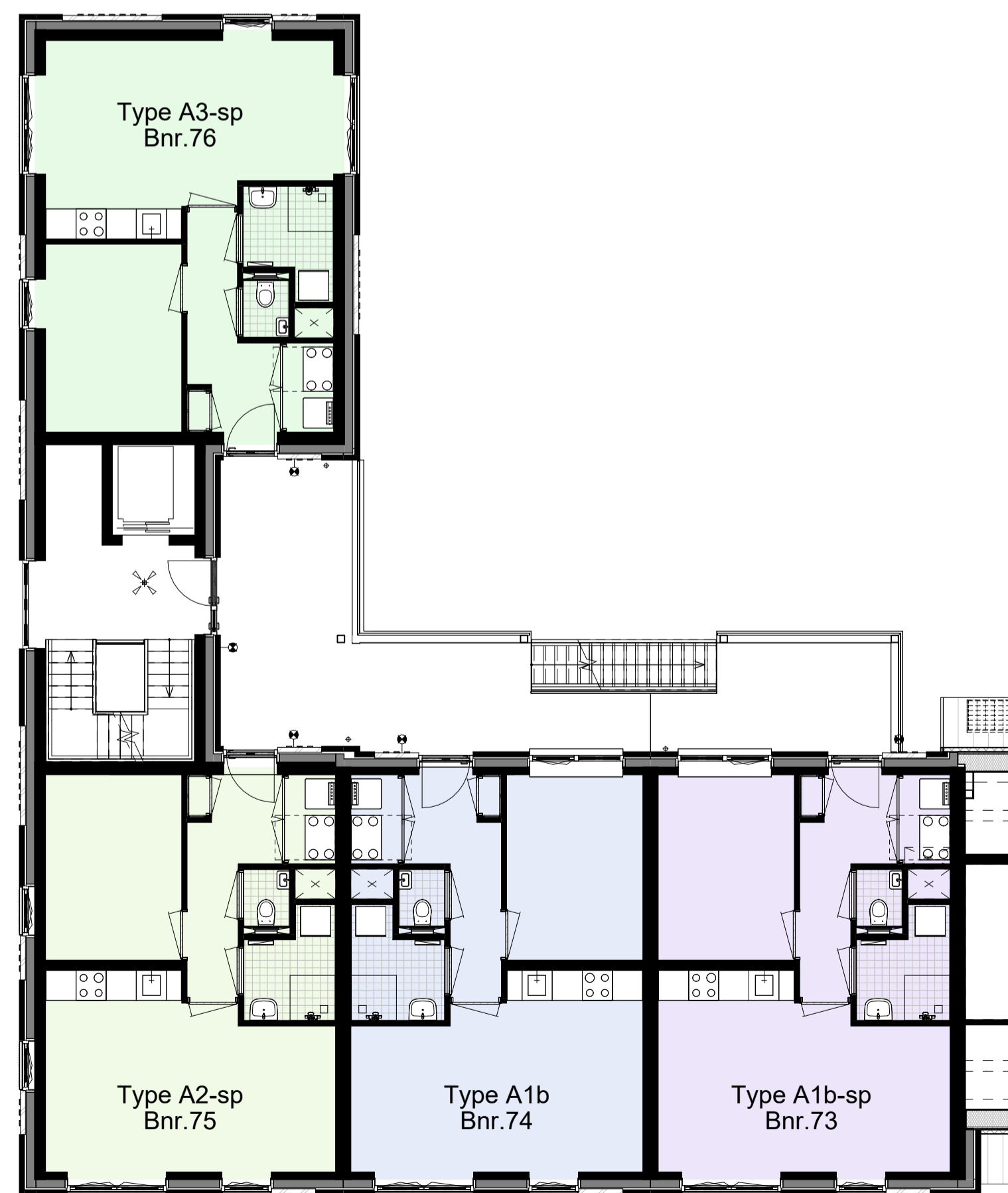
Tweede verdieping, 6000+P