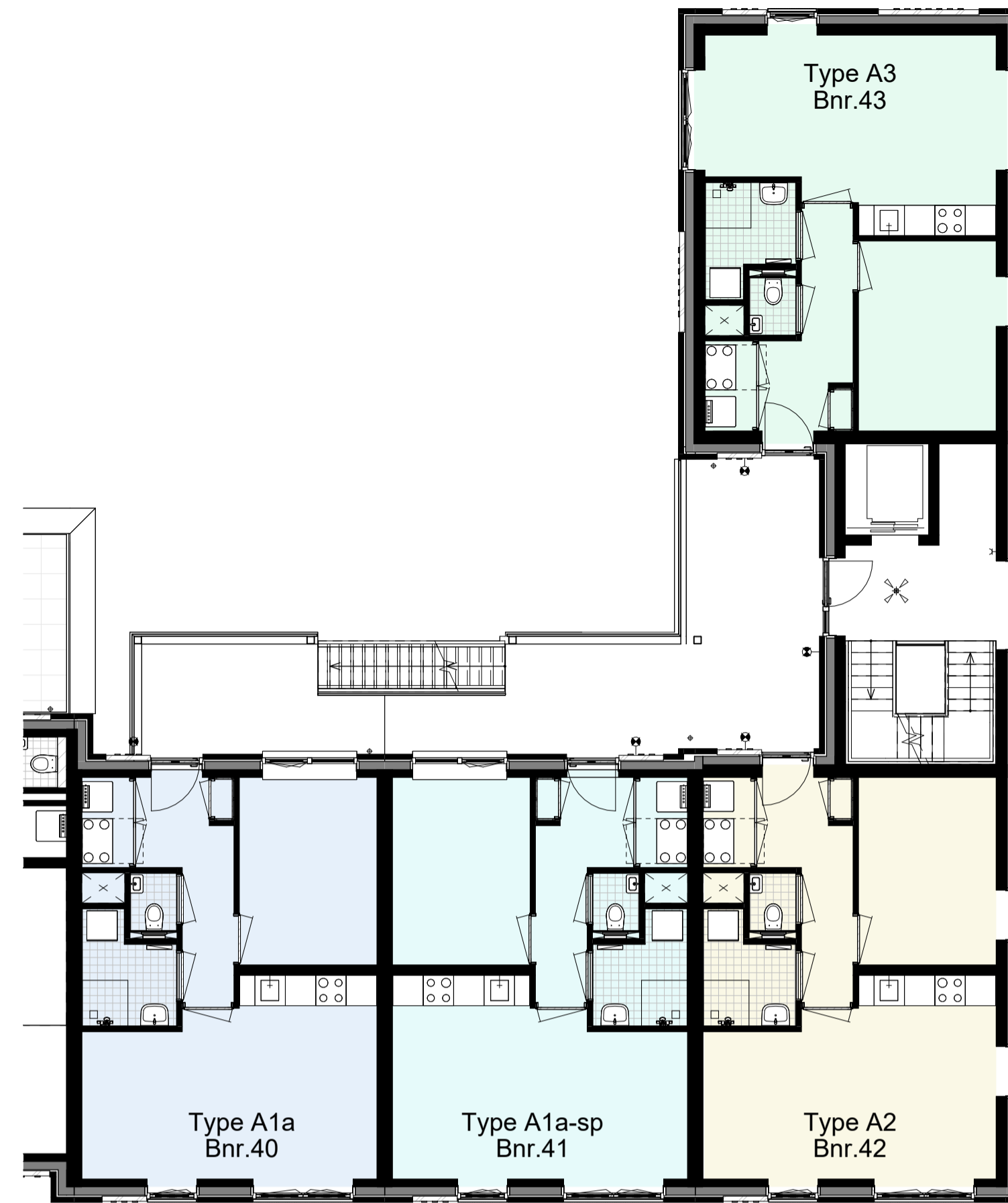
Eerste verdieping, 3000+P