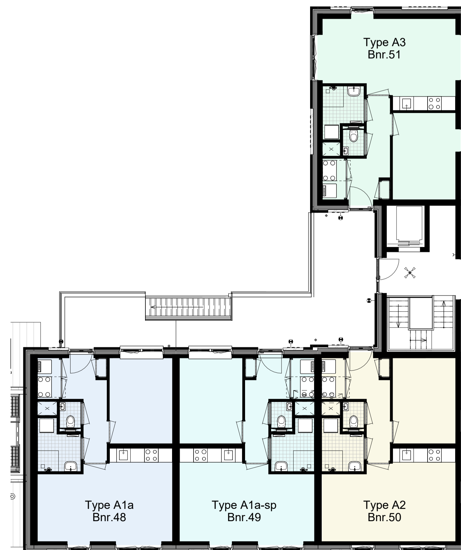
Derde verdieping, 9000+P